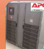
Onduleur de 0,1 à 800 KVA