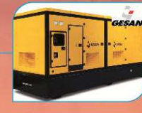
Groupe Electrogène de 0 à 3000 KVA