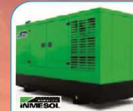
Groupe Electrogène de 0 à 3000 KVA