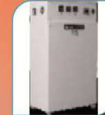
Régulateur de 1 à 3000 KVA